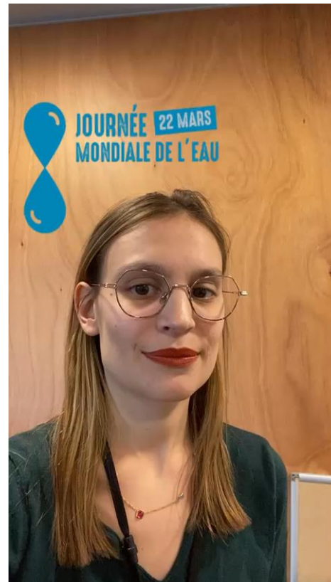
exemple de message

Poste la vidéo en story en ajoutant le #ChaqueMinuteCompte et en taguant @unicef_france